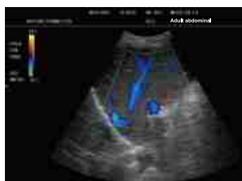
Morfología del Tejido Hepático (imagen Doopler en color)